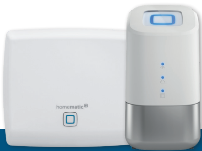
Access Point und Home Control Unit

Machen Sie das Zuhause Ihrer Kunden smart mit Homematic IP. Flexibel und zuverlässig lässt sich das System auf die Wünsche des Kunden anpassen und individualisieren. Die einfache Einrichtung und die vielfältigen Möglichkeiten werden Sie und Ihre Kunden begeistern.