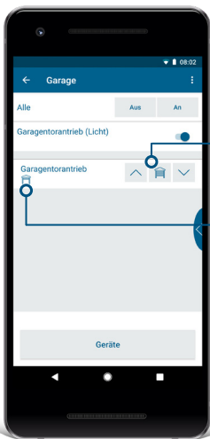
Komfortable Steuerung des Garagentors: Öffnen, Schließen und Lüftungsposition